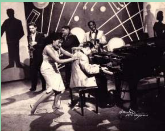
La Lupe en una de sus actuaciones

Editorial Boletín Imagen Afrohispana. Foto suministrada por Eddie Rosa.