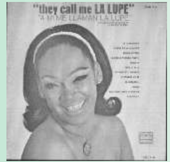
Portada del disco de La Lupe (Nota editorial)