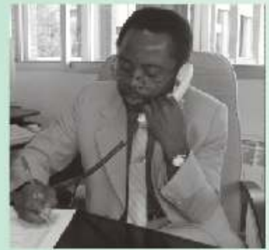
IMAGEN AFROHISPANA, Hecho en España Edita: TRM / Imagen Afrohispana 2008 Todos los derechos reservados