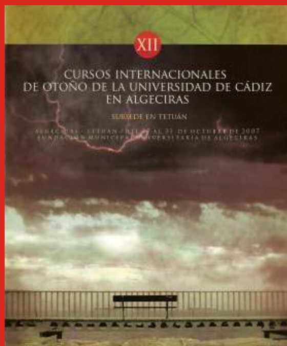
Cartel de los cursos