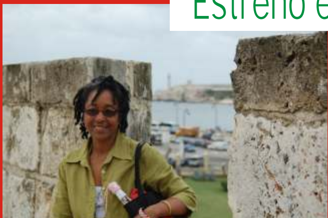
Gloria Rolando

La cineasta cubana Gloria Rolando estrenó en el marco del 28 Festival de Cine de La Habana, Cuba, su documental " Pasajes del corazón y la memoria ", un estreno concurrido que tubo lugar en el Centro Hispanoamericano de la Cultura.